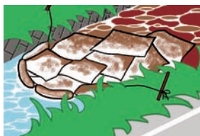
◀河川流出した危険物を吸着材で回収の様子