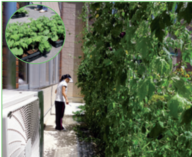
● 岡谷市 神明小学校 ●