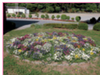
● 富士見町 境小学校 ●