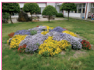
● 茅野市 豊平小学校 ●