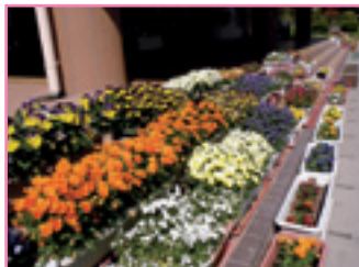
● 下諏訪町 下諏訪社中学校 ●