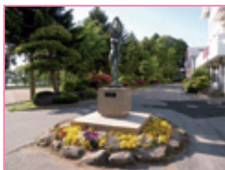
● 原村 原中学校 ●