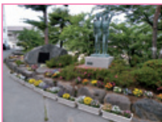
● 諏訪市 諏訪西中学校 ●