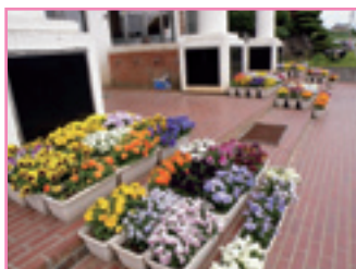
● 茅野市 東部中学校 ●