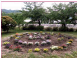
● 諏訪市 中洲小学校 ●