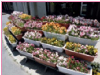
● 岡谷市 神明小学校 ●