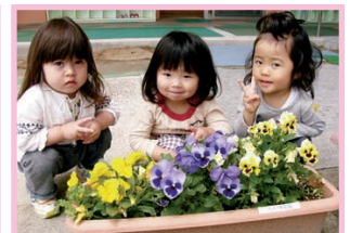
茅野市 ちの保育園

諏訪広域連合では、児童・生徒のみなさんと圏域住民のみなさんに、花いっぱいの環境に親しんでいただけるよう、4月に圏域内の小中学校・保育園・公共施設にパンジーとピオラの苗9,523ポットを配布しました。花は各施設で大切に育てられ、きれいに咲いていました。