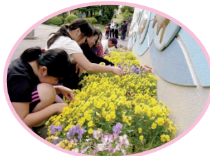
下諏訪町 下諏訪北小学校 フラワー委員会のメンバー