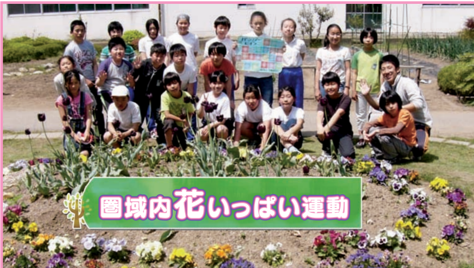
諏訪市 城南小学校 生物委員会