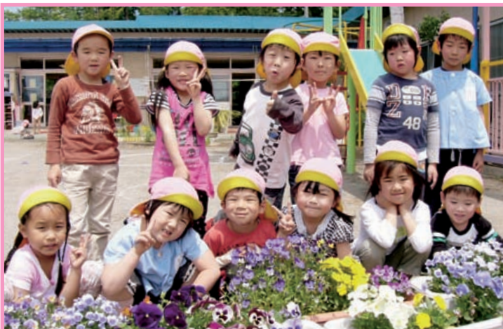
茅野市 小泉保育園 ひまわり組