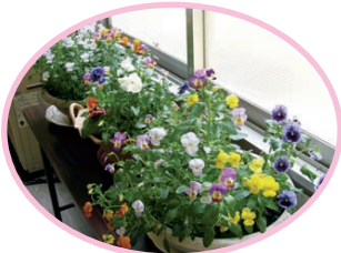
岡谷市 上の原小学校1学年室