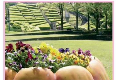
岡谷市 鳥居平やまびこ公園