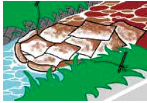
(河川流出した危険物を吸着材で回収の様子)

施設の日常点検や定期点検を行い、取扱う際の基本的動作や知識を再確認してください。