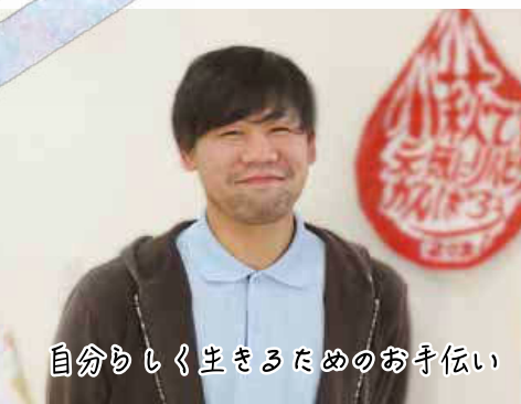
自分らしく生きるためのお手伝い