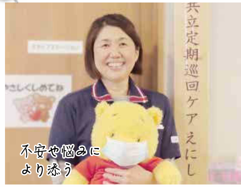
不安や悩みにより添う